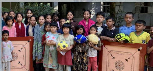
◀ 支援者からのプレゼント！サッカーボールと ケランボード（伝統ボードゲーム）に大喜び