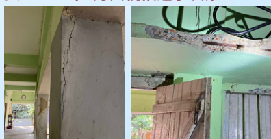
設備調査②建物が老朽化。やや危険 改修したいが費用が課題