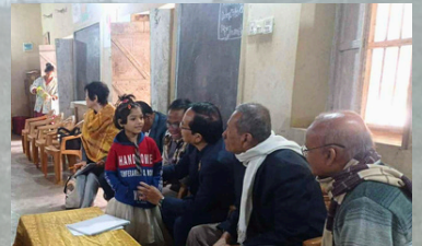
▲2025年12月25日 新寮生の面接に立会いました！47名応募で14名が合格。倍率3倍です。