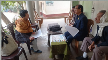
◀ 副代表が現地コミッティと意見交換 現地の自助努力の意識に感激！